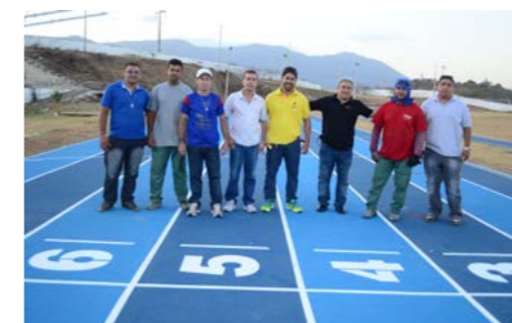
Leia a matéria completa no Blog de Sobral ( blog.sobral.ce.gov.br ).

A Prefeitura de Sobral, por meio da Secretaria do Esporte, concluiu na quinta-feira (1º), a colocação do piso sintético da pista de atletismo da Vila Olímpica de Sobral. Com 400 metros de extensão e oito raias de corrida, a pista de atletismo atende aos padrões da Confederação Brasileira de Atletismo e da Federação Internacional de Atletismo, sendo similar a pista de atletismo do Estádio João Havelange, o Engenhão, que foi palco dos Jogos Pan Americanos de 2007, no Rio de Janeiro.