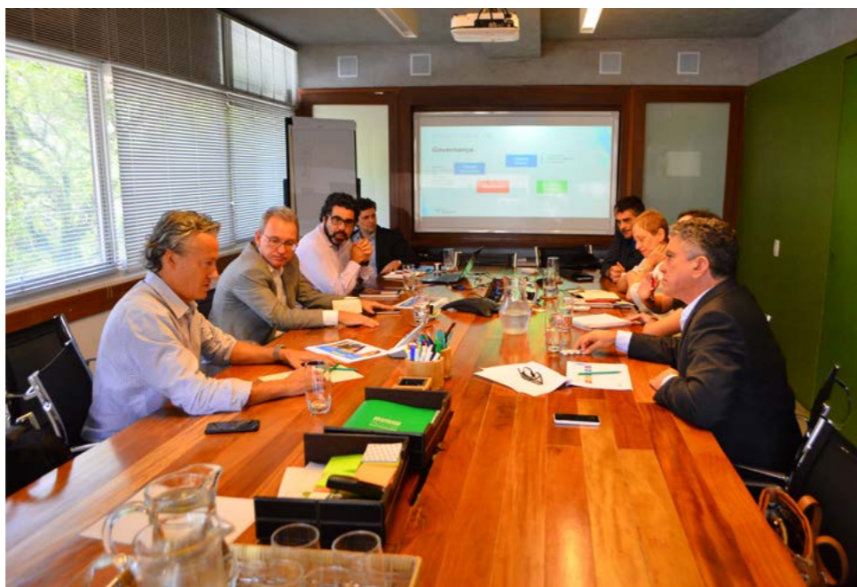
vão além de um governo e envolvam todo o coletivo da sociedade", afirmou o presidente

"Sobral sempre foi uma cidade admirada pela eficiência na gestão. Com esse projeto queremos construir sonhos para a cidade que